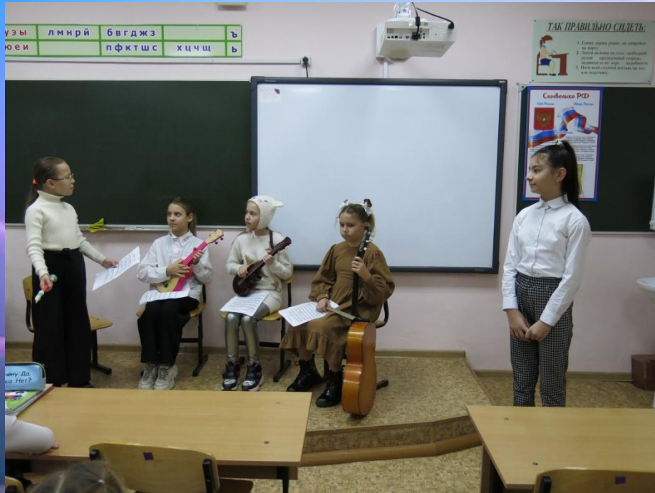
4- КЛАСС СКАЗКА «ВОЛК И ЯГНЁНОК»